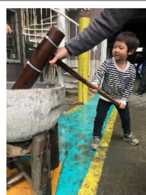
【神守研究開発センターにて】